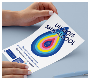
2. Des flyers