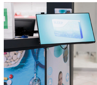
4. Une vidéo muette