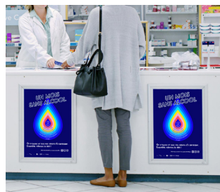
1. Une affiche

Coconstruits à l'aide de professionnelles de 1 ère ligne, voici 4 outils pour soutenir la campagne :