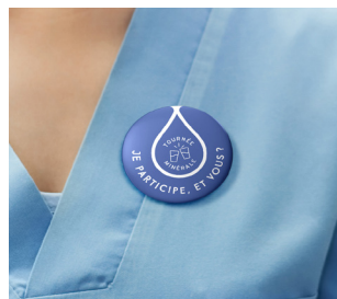
3. Un badge